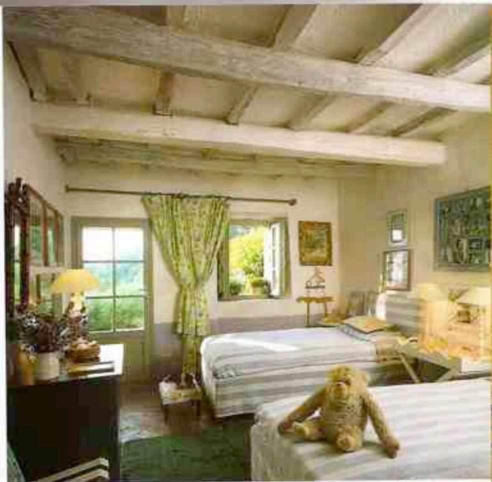
A SINISTRA: rami di timo e di rosmarino e cesti metallici per frutta e verdura pendono dalle travi della cucina arredata con mobili decapati. Per il pavimento è stato utilizzato dal cotto vecchio, recuperato sul luogo. SOPRA: la camera da letto dei bambini; le cortine, i postafotografie e le panchette poggiatepiedi rivestite di stoffa vengono dal laboratorio di Ilaria Miani.

tro. Qui i soffitti, in travi di castagno, sono bassi e per guadagnarci in altezza abbiamo dovuto abbassare, di almeno mezzo metro, il pianterreno. I pavimenti sono in cotto calpestato, asciugato al sole e lavorato a mano da artigiani di Castelviscardo. I coppi del tetto, invece, sono stati recuperati nella zona".